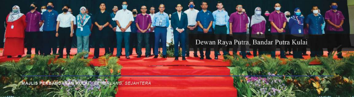
Dewan Raya Putra, Bandar Putra Kulai