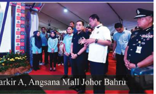
Kawasan Parkir A, Angsana Mall Johor Bahru