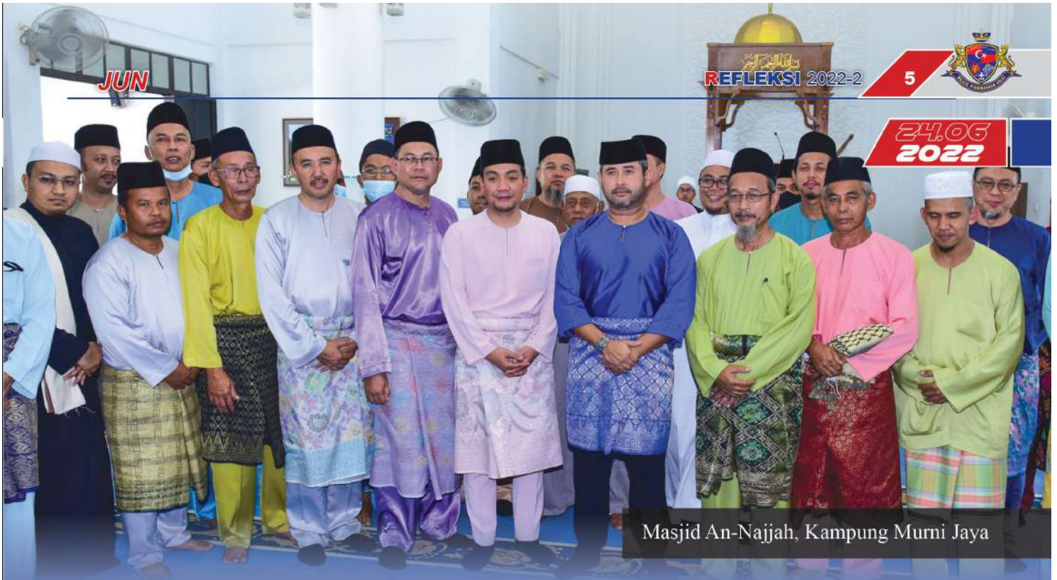
Masjid An-Najjah, Kampung Murni Jaya