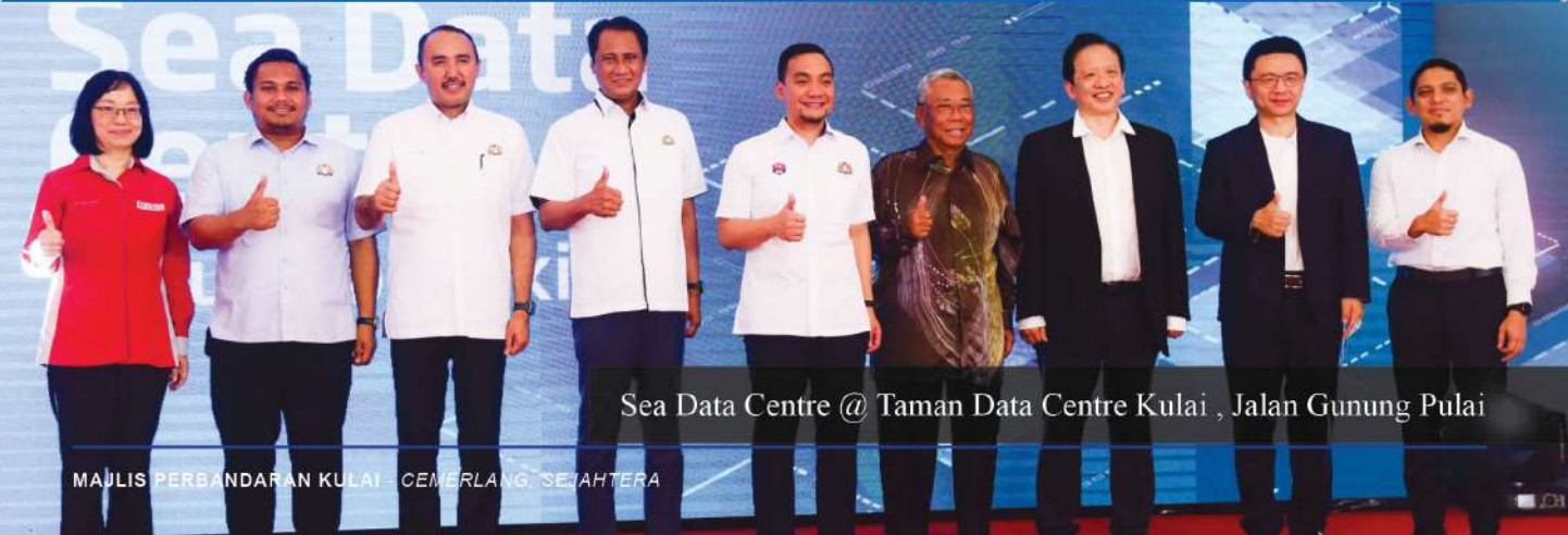
Sea Data Centre @ Taman Data Centre Kulai , Jalan Gunung Pulai