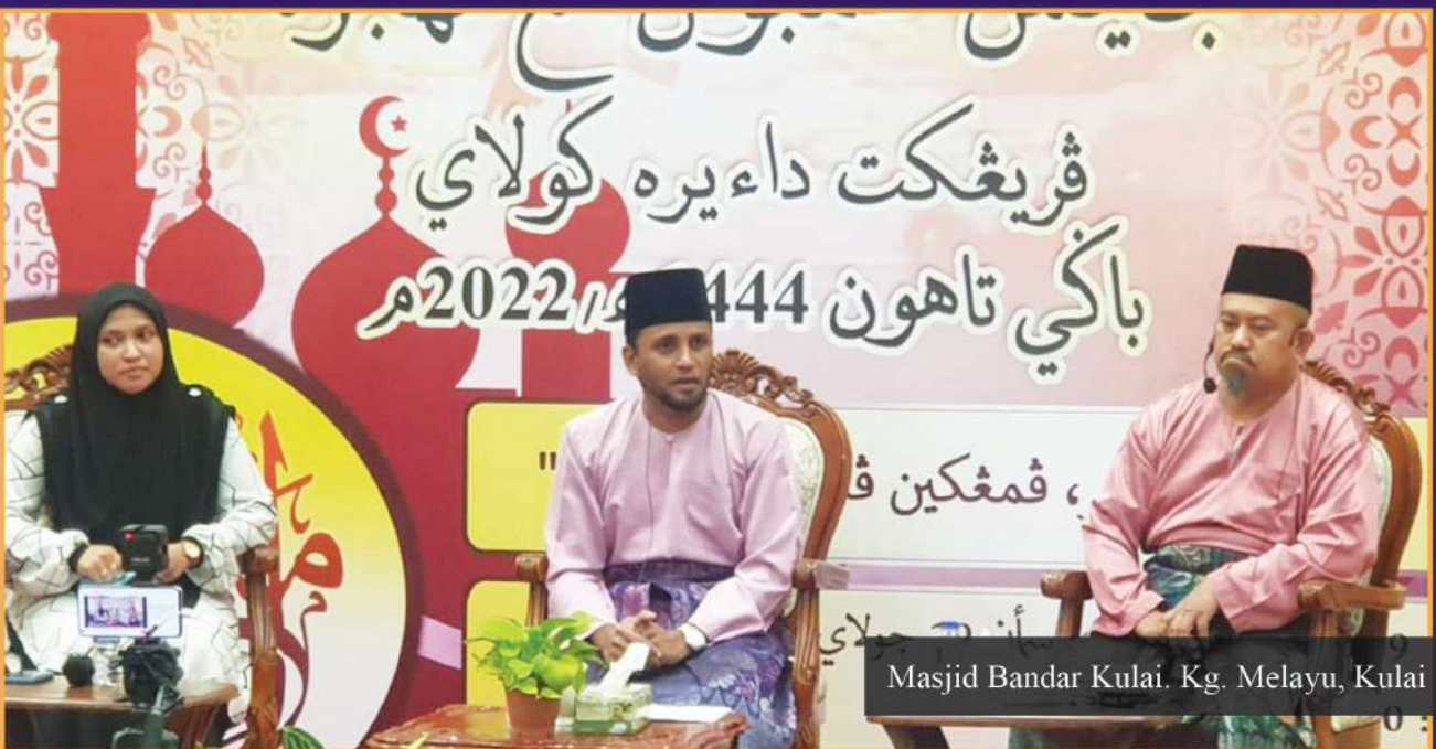
Masjid Bandar Kulai, Kg. Melayu, Kulai