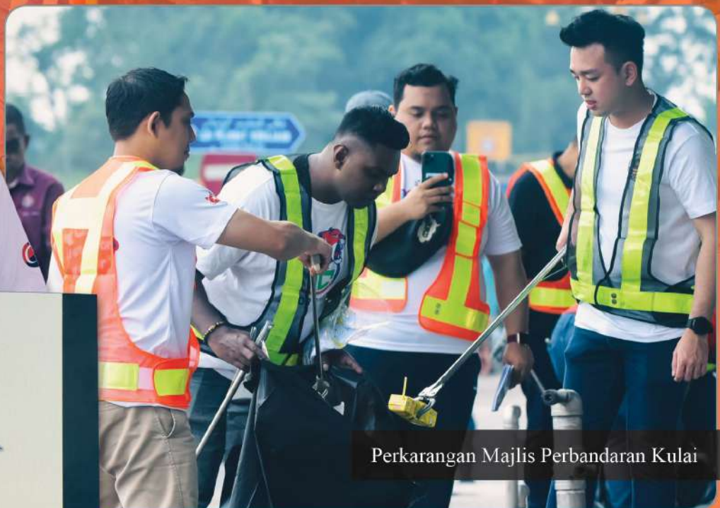
Perkarangan Majlis Perbandaran Kulai