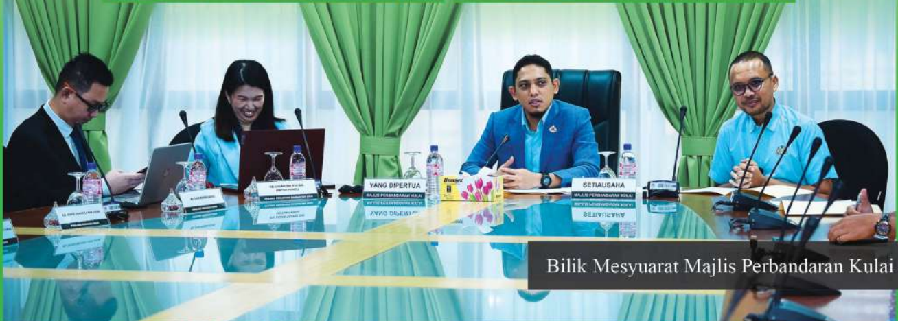
Bilik Mesyuarat Majlis Perbandaran Kulai